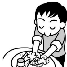
うがいや手洗いを しっかりする