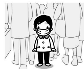
ひとご 人混みでは マスクをする

インフルエンザと新型コロナウイルスについては、出席停止扱いとなりますが、 登校停止意見書のご提出は不要となっております。