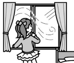
部屋の換気をする