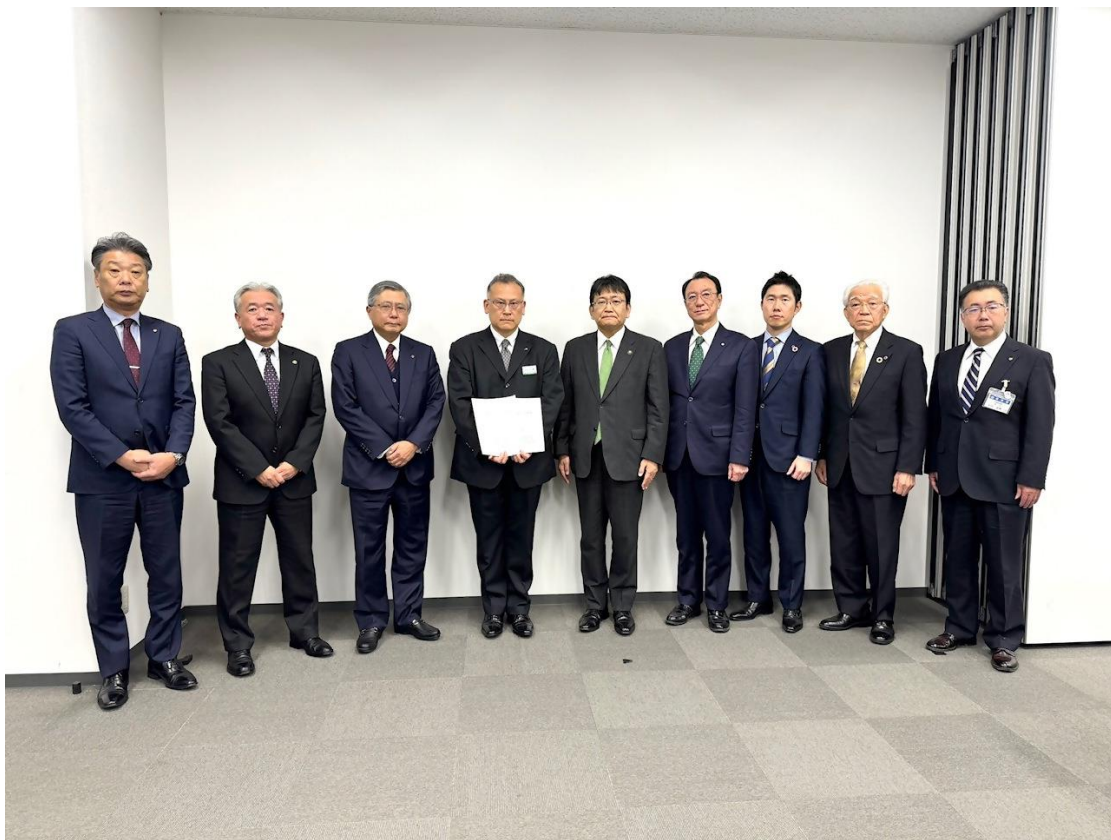
▲JR 東日本土澤千葉支社長への要望の様子