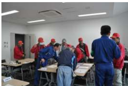
▲災害対策本部の様子