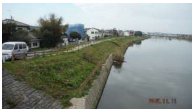
きれいになりました