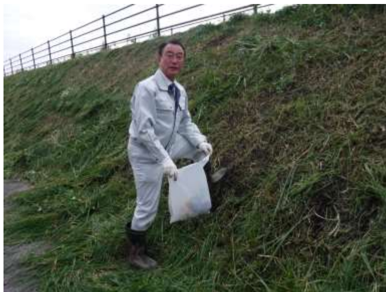
ゴミ拾いをする町長

一宮川をきれいにする会では、毎年、一宮をきれいな河川として維持することを目指し、一宮川に隣接する住民の方と一宮川に関する各種団体、企業とボランティア等で堤防の草刈を行いました。 【都市環境課 吉野 彰洋】