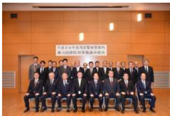
▲総会出席者の集合写真