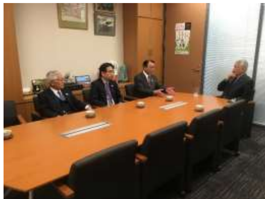
森代議士との面談