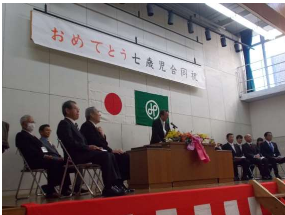
▲開会式での町長あいさつ