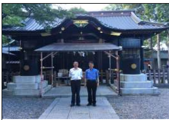
町長と古宮副事務総長（玉前神社境内）

馬淵町長と担当職員で、オリンピックサーフィン競技会場の釣ヶ崎海岸、一宮海岸、海岸広場、芥川荘、玉前神社をご案内して説明させていただきました。