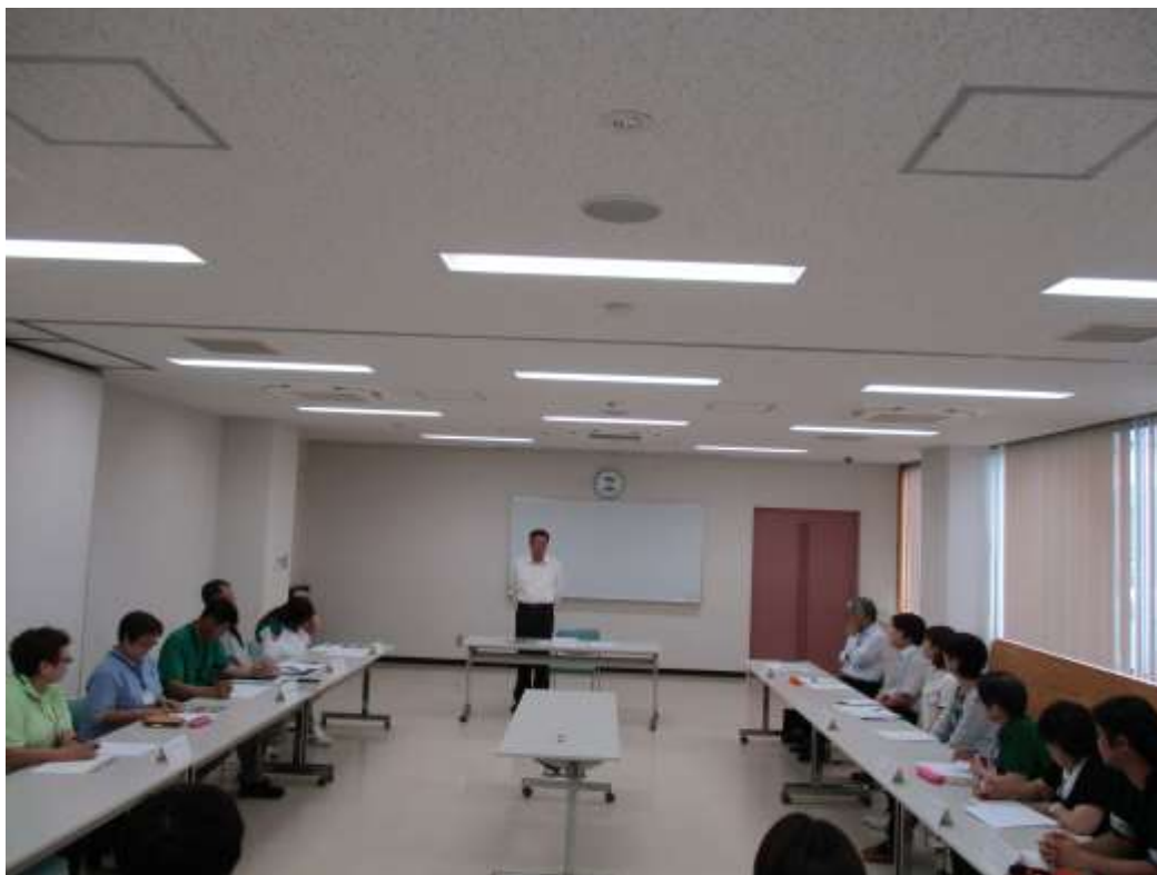
町内の9事業所の方々との意見交換