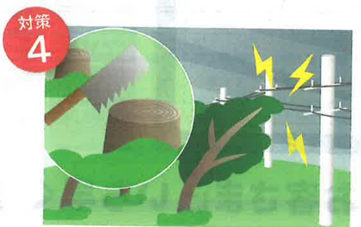
傾斜等で倒れそうな樹木は伐採しましょう

ビニールやトタン、 樹木等が電線に引っかかると 長期間の停電の原因になる 場合があります