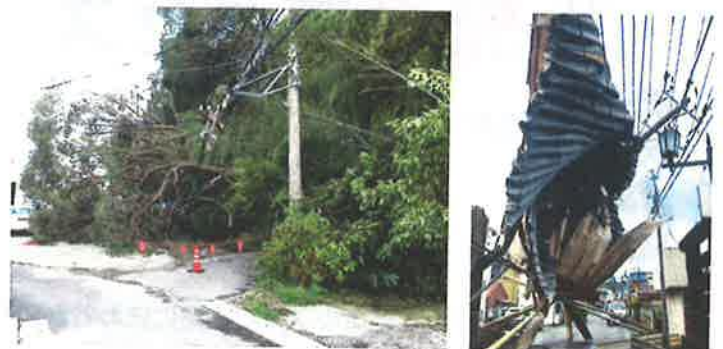
2019年台風15号襲来時の実際の被害の様子

ビニールやトタン、 樹木等が電線に引っかかると 長期間の停電の原因になる 場合があります