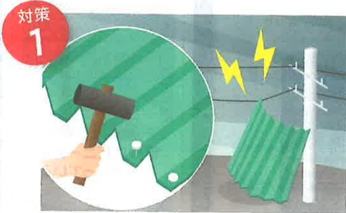
トタンはしっかりと固定しましょう