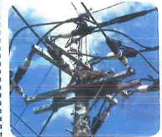
カラスの巣がある