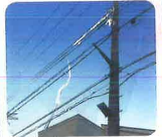
電線にビニールが引っかかっている