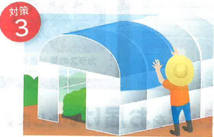
ビニールの飛散を防ぎましょう