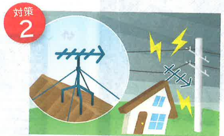
アンテナはしっかりと固定しましょう