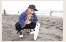
※ココロコ遠藤 2019年の様子

お笑い芸人と共に楽しく ビーチクリーンを行いましょう。 ※詳細は決まり次第SNSで告知します ※参加は自由です