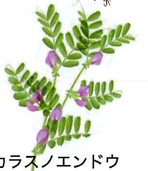
カラスノエンドウ