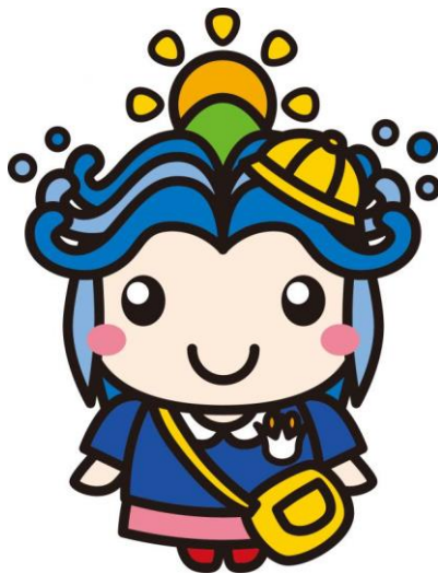
一宮町キャラクター 一宮いっちゃん