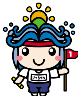
一宮町キャラクター 一宮いっちゃん