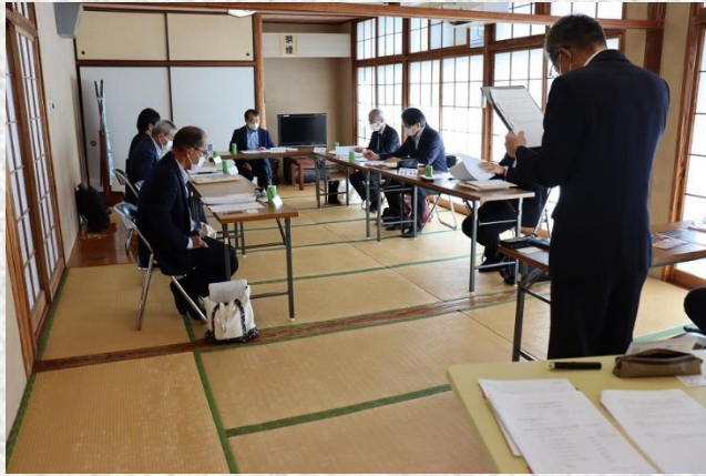
▲令和4年度第1回会議の様子

編さん基本方針は町HPで公開しております。 令和5年(2023)1月22日(日)には中央公民館大会議室にて、令和4年度第2回編さん委員会が開催され、今後の調査について協議を行いました。 現在、町内の資料調査を中心に事業を進めています。令和5年度以降は、町内は勿論、町外、県外にまで範囲を広げて調査を進めていく予定です。