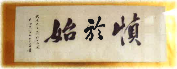
▲加納久宜筆「慎於始」 (大正8年(1919)、町所蔵)