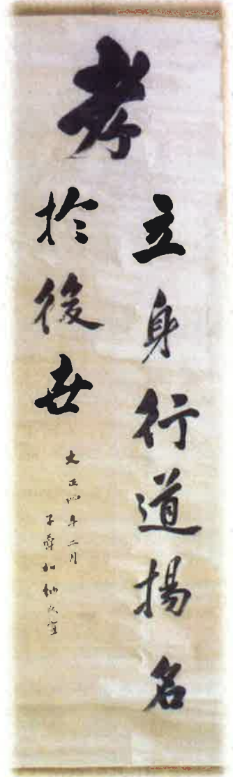
▲加納久宜筆「考」 (大正4年(1915)、町教委所蔵)

会 期：令和5年1月20日(金) ～ 3月27日(月) 会 場：一宮町中央公民館2階・歴史資料展示室(一宮町一宮2460) 開室日：火～土 8:30～21:00 日・月・祝 8:30～17:00 休館日：第3日曜日、臨時休館日(HPでご確認ください) 見学：無料