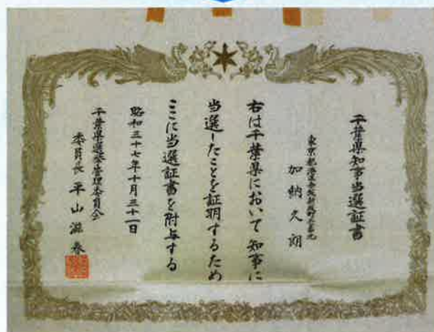
千葉県知事当選証書(「加納家史料」E9(4))▶