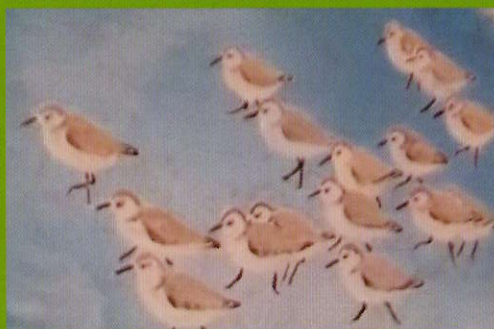
▲秋山章男氏筆「ミュビシギ」 (「南九十九里におけるミュビシギの行動生態」より)