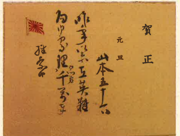
▲加納久朗宛山本五十六年賀状

(秩父宮殿下の横浜正金銀行ロンドン支店 訪問(昭和12年)、「加納家史料」B8(8))