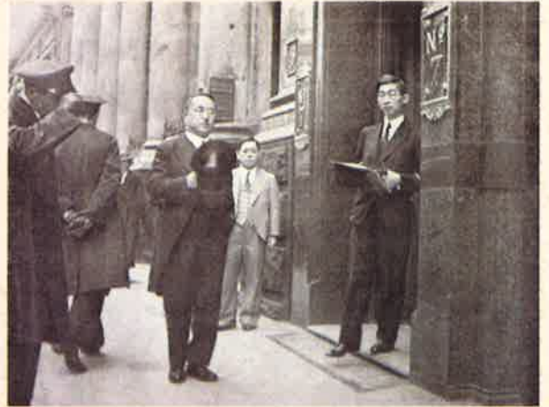
▲秩父宮殿下(右)と加納久朗(左)

(秩父宮殿下の横浜正金銀行ロンドン支店 訪問(昭和12年)、「加納家史料」B8(8))