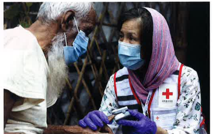
海外の紛争や災害で苦しむ人々を支援します。