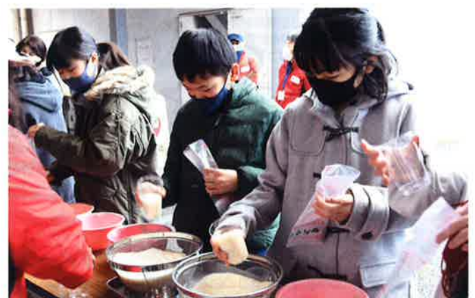
赤十字活動への参加を通じて 豊かな心をもった子どもたちの育成に取り組みます。