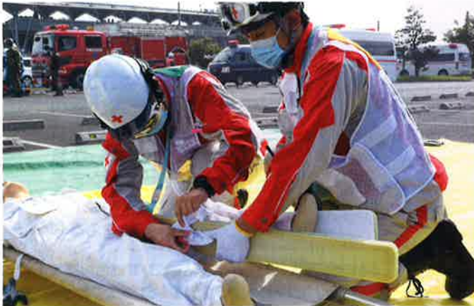
感染症流行下においても災害救護活動を実施します。

日本赤十字社は、苦しんでいる人を救いたいという思いを結集し、 人のいのちと健康、尊厳を守ることを使命として、 世界192の国と地域に組織された赤十字・赤新月社と連携し、 国内外において様々な人道的活動を展開しています。