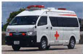
災害救援車両 1,100万円