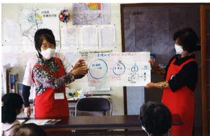
赤十字奉仕団が地域における高齢者の支援などの 様々なボランティア活動を行います。