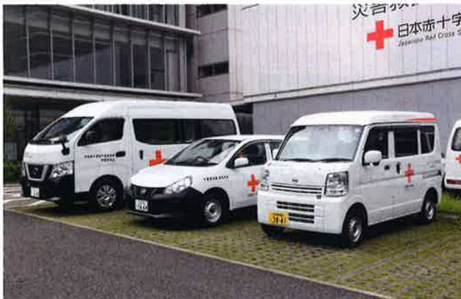
災害時に必要な施設や資機材を整備します。