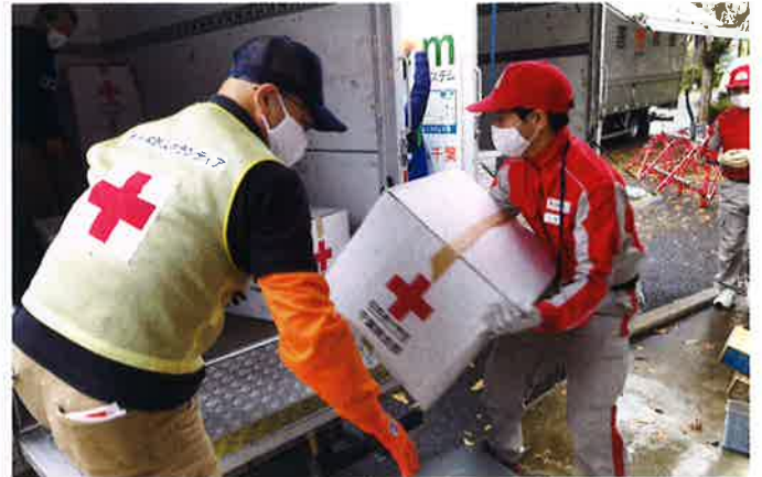
大規模災害や火災・水害等により被災された方に 迅速に救援物資をお届けします。