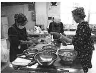
福祉ボランティア活動