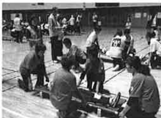
日赤奉仕団の活動