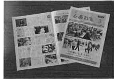
福祉広報「しあわせ」