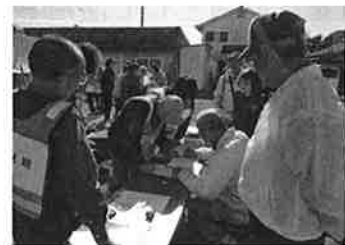
災害ボランティア立上げ訓練