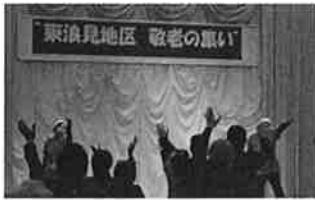
地区社協敬老のつどい