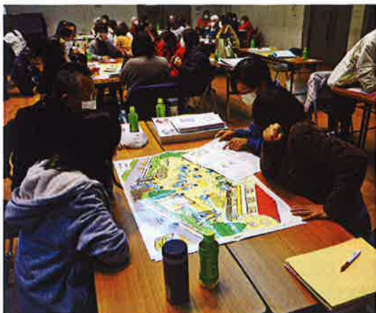
避難するときはどうしたら...

何度も「よく絵を見て表情や、視線を見て」「子ども達の気付きを大切にして下さい」というご指導がありました。ただ教えられるのではなく、「自分達で気付き、行動すること」まさに赤十字奉仕団の活動理念などに関心しました。