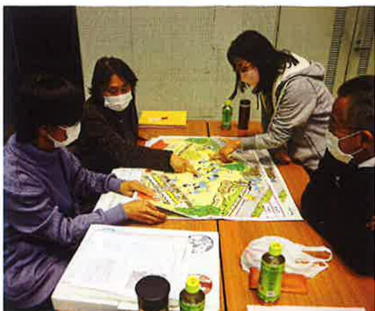
危ないところはどこかな

講師の先生の指導のもと、園児になり「ふだんの教室の様子・遊んでいる園庭の様子、よく見て地震が起きたら危ない所は無いか」また、「避難する時にはどうしたら良いか」グループで話し合いました。その中で、