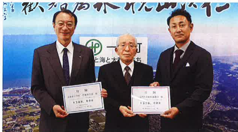
左から馬淵町長、社協白井会長、本間代表取締役

令和4年12月9日、ワイズチャリティカップ(ゴルフ大会)で集まったチャリティ金の目録贈呈式が行われ、日本赤十字社千葉県支部に30万円、一宮町社会福祉協議会に30万円が寄付されました。 地域福祉等、大切に活用させていただきます。